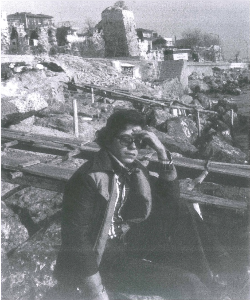
Sahilyolu surları dolanan yol, denizde de balıkçı teknesi yakaladığı balıkları satma yolunda, gemiler ise demirlemiş Boğaz'a girmek için sıra beklemekteler. Zamanın favorilerinden montaj sanayii Dodge kamyonet sahil kaldırımında park etmiş. Sarayburnu 24 Ocak 1975 deniz kenarı.