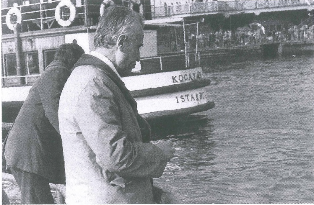
Denizin dibinde hayaller, sathında hakikatler. Şehir Hatları vapurunda can simitleri. Gündüz gözüyle, geceleri şenlenen meşhur Galata Köprü altı. Berduşların beleş yatakhanesi. Haliç'in giriş kapısı. Yegânesin İstanbul! Kocataş kim imiş, ne imiş acaba? Eminönü Deniz Kenarı. 4 Ocak 1975.