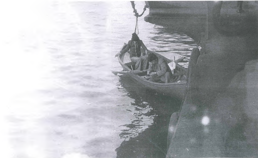
Galata Köprüsü'nün altında balıkçı. 4 Ocak 1975.